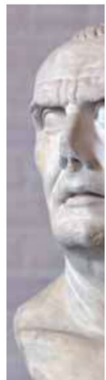
... contre Marius, chef des populares.

tendances politiques s'opposent : les optimates , menés par Sylla (dit aussi Sulla), et les populaires , conduits par Marius, puis Cinna.