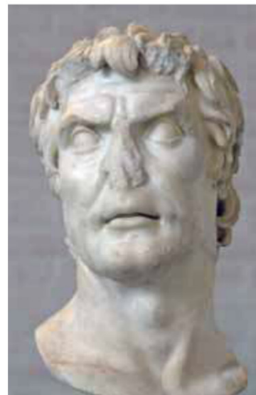
Sylla, chef des optimates...

encore plus riches) et les pauvres (restés pauvres). D'autre part, les cités soumises par Rome se sentent exploitées et se révoltent. C'est le cas par exemple des Italiens alliés de Rome, qui réclament l'égalité avec les citoyens romains. Dans ce contexte de crise, des guerres civiles o éclatent, où deux