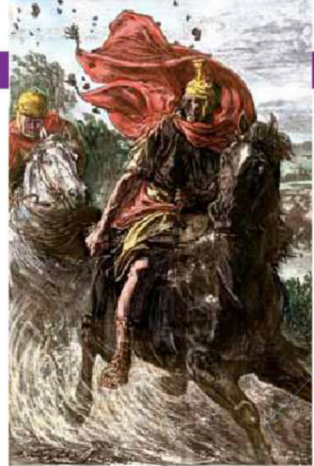
Pompée vient de perdre la bataille de Pharsale (en Grèce) : il doit s'enfuir au plus vite !

Les deux ennemis s'engagent dans une course poursuite à travers le monde romain. Après le passage du Rubicon, César fonce droit sur Rome. Pompée, pris de panique, quitte la cité, et même le pays. Il ne faut à César que neuf semaines pour soumettre l'Italie entière. Avant de poursuivre son rival, il se rend en Espagne pour vaincre les troupes restées fidèles à Pompée. En route, il soumet Massilia (Marseille), qui s'était rangée du côté de Pompée. Il embarque alors pour la Thessalie (en Grèce), où s'est réfugié Pompée. La bataille décisive entre les deux hommes a lieu à Pharsale le 9 août 48. Pompée, vaincu, s'enfuit en Égypte, où il espère trouver la protection du pharaon Ptolémée XIII. Mais ce dernier, pensant s'attirer les faveurs de César, le fait exécuter puis