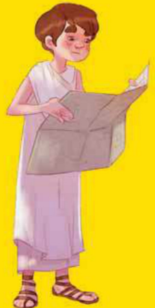
3. Je suis édile

● B. Gardien du Trésor public, je suis en charge des finances publiques.