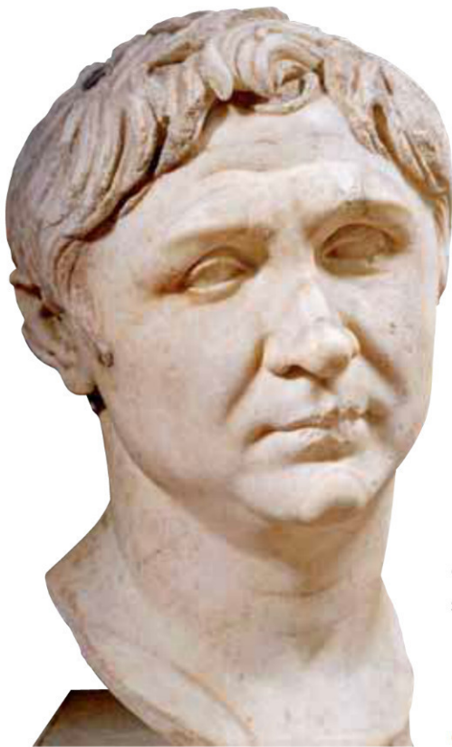
Voici Pompée le Grand, qui lui aussi rêve de pouvoir...

En 73, César est de retour à Rome. À 27 ans, il est bien décidé à entamer le cursus honorum o , dans le but de devenir consul. Pour être élu, il flatte les hommes puissants de Rome. Il dépense sans compter, il s'endette même, et entre dans l'entourage du richissime Crassus, qui lui prête des sommes extravagantes. La première étape du cursus honorum est franchie en 68, lorsqu'il est élu questeur en Espagne ; la deuxième en 65, quand il devient édile. Sa femme Cornélia étant décédée, il se remarie avec Pompéia. En tant qu'édile, il organise pour le peuple des jeux somptueux