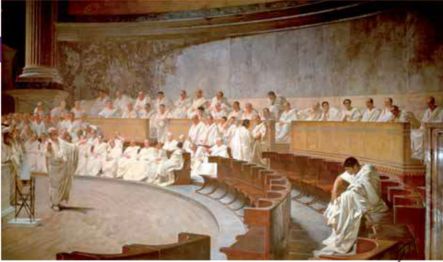
Les sénateurs siègent au Sénat et débattent de la vie politique romaine.

il reçoit, en remerciement du pharaon Ptolémée XII, une grosse somme d'argent qui lui permet de rembourser toutes ses dettes. Comme, selon la loi, le consulat ne peut être occupé que pendant un an , César parvient subtilement à se faire attribuer les provinces qu'il désire gouverner quand il ne sera plus consul. C'est ainsi qu'au terme de son mandat, le Sénat* lui accorde pour cinq ans le gouvernement