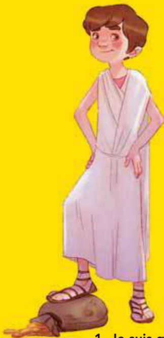
1. Je suis questeur

Avant de devenir consul, le magistrat romain effectue son cursus honorum : il doit passer par la questure, puis l'édilité et enfin la préture... Mais enfin, tout ça pour quoi faire ? À toi de retrouver le rôle et les tâches de chacun !