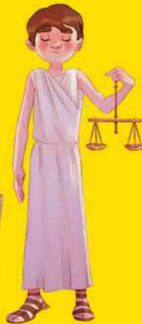
2. Je suis préteur

● A. L'administration urbaine de la ville de Rome n'a pas de secret pour moi, je veille à son bon fonctionnement.