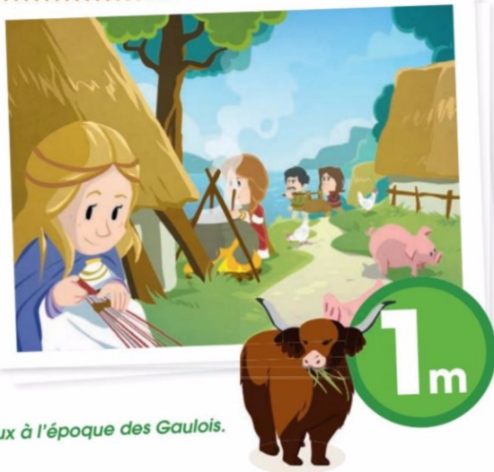
C'est la taille moyenne des vaches et des chevaux à l'époque des Gaulois.

La majorité de la population gauloise vit à la ferme, que plusieurs familles entretiennent. Ces excellents agriculteurs cultivent les terres riches sous un climat très favorable, à l'aide d'ingénieux outils de leur invention : charrue primitive, faux, serpe et même moissonneuse... Ils élèvent des porcs, des vaches, des moutons et des chèvres. Les animaux de basse-cour fournissent de la viande et des œufs. À la maison, essentiellement fabriquée en bois, tout le monde mange et dort dans une même et vaste pièce.