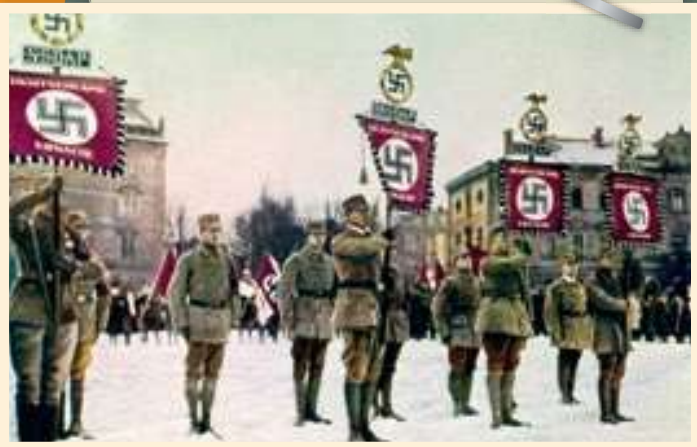
Comme symbole de cet empire, Hitler choisit la croix gammée.

Hitler a trois objectifs : réarmer le pays, l'agrandir et exclure certaines personnes, dont les opposants politiques et les Juifs (ceux qui ont pour religion le judaïsme). Hitler rêve de fonder un empire puissant et très grand : le III e Reich.