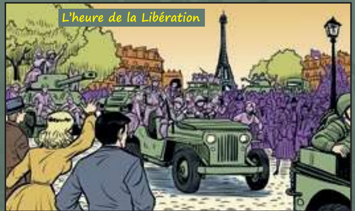
L'heure de la Libération

Le 6 juin 1944, avec l'aide des résistants, les Alliés (les troupes anglaises et américaines) débarquent en Normandie. C'est la plus grande opération jamais menée dans les airs et sur l'eau ! Les Allemands sont rapidement obligés de se replier.