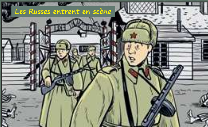
Les Russes entrent en scène

Le 15 août, les Alliés sont rejoints par d'autres soldats qui ont débarqué en Provence. Ils se dirigent vers Paris pour faire partir les Allemands. Le 25 août, Paris est libéré. C'est la fête ! Les Alliés progressent ensuite vers l'Allemagne.