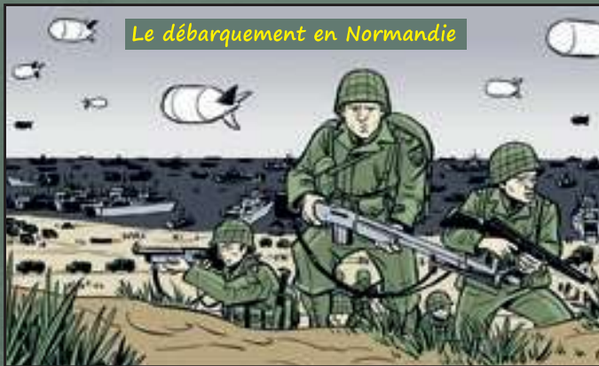
Le débarquement en Normandie

Le 6 juin 1944, avec l'aide des résistants, les Alliés (les troupes anglaises et américaines) débarquent en Normandie. C'est la plus grande opération jamais menée dans les airs et sur l'eau ! Les Allemands sont rapidement obligés de se replier.