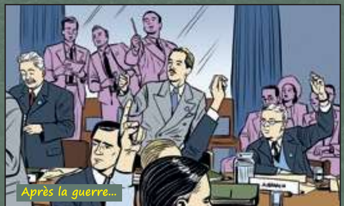
Après la guerre...

Les derniers mois de la guerre dans le Pacifique sont violents. Face à la résistance des Japonais (alliés des Allemands), les États-Unis décident d'utiliser une nouvelle arme, la bombe atomique, sur deux de leurs villes : Hiroshima et Nagasaki. Le Japon capitule le 2 septembre 1945. La guerre est officiellement terminée !