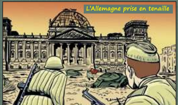
L'Allemagne prise en tenaille

Au même moment, les Russes délivrent l'Europe de l'Est, également occupée par les Allemands. En Pologne, ils libèrent le camp d'Auschwitz, où de nombreux Juifs étaient enfermés.