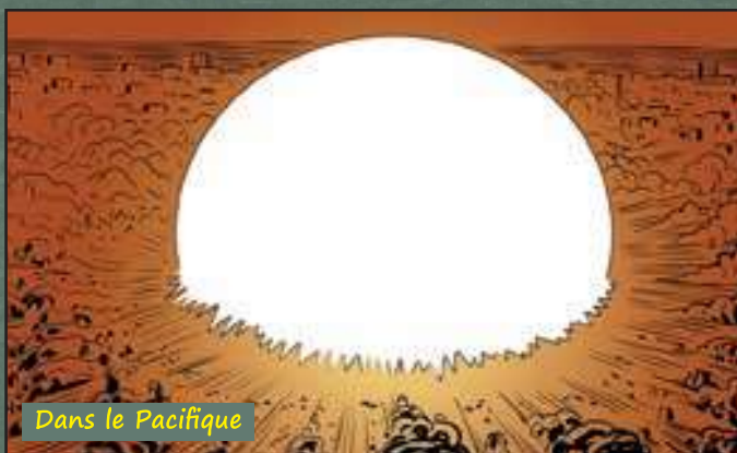
Dans le Pacifique

En avril 1945, les armées russes et américaines se rejoignent en Allemagne. Hitler prend peur et se donne la mort. L'Allemagne capitule officiellement le 8 mai 1945. Ça y est : la guerre est terminée en Europe !