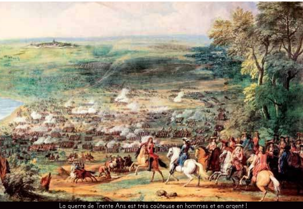
La guerre de Trente Ans est très coûteuse en hommes et en argent !