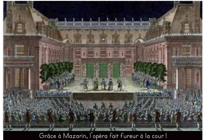
Grâce à Mazarin, l'opéra fait fureur à la cour !

représentations théâtrales . Il favorise également les membres de sa famille, en les faisant venir à Paris pour les marier dans de grandes familles françaises.