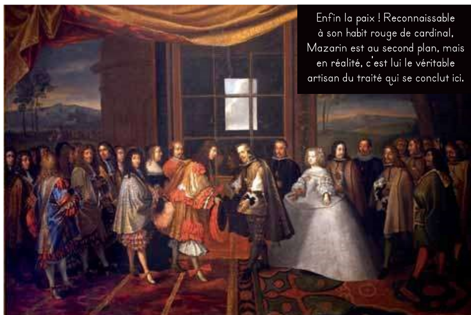
Enfin la paix ! Reconnaisable à son habit rouge de cardinal, Mazarin est au second plan, mais en réalité, c'est lui le véritable artisan du traité qui se conclut ici.

pays n'ont pas trouvé de terrain d'entente. Pour vaincre l'Espagne, Mazarin demande une alliance à l'Angleterre et sort finalement vainqueur en 1659. C'est lui qui signe le traité de paix (dit « traité des Pyrénées »).