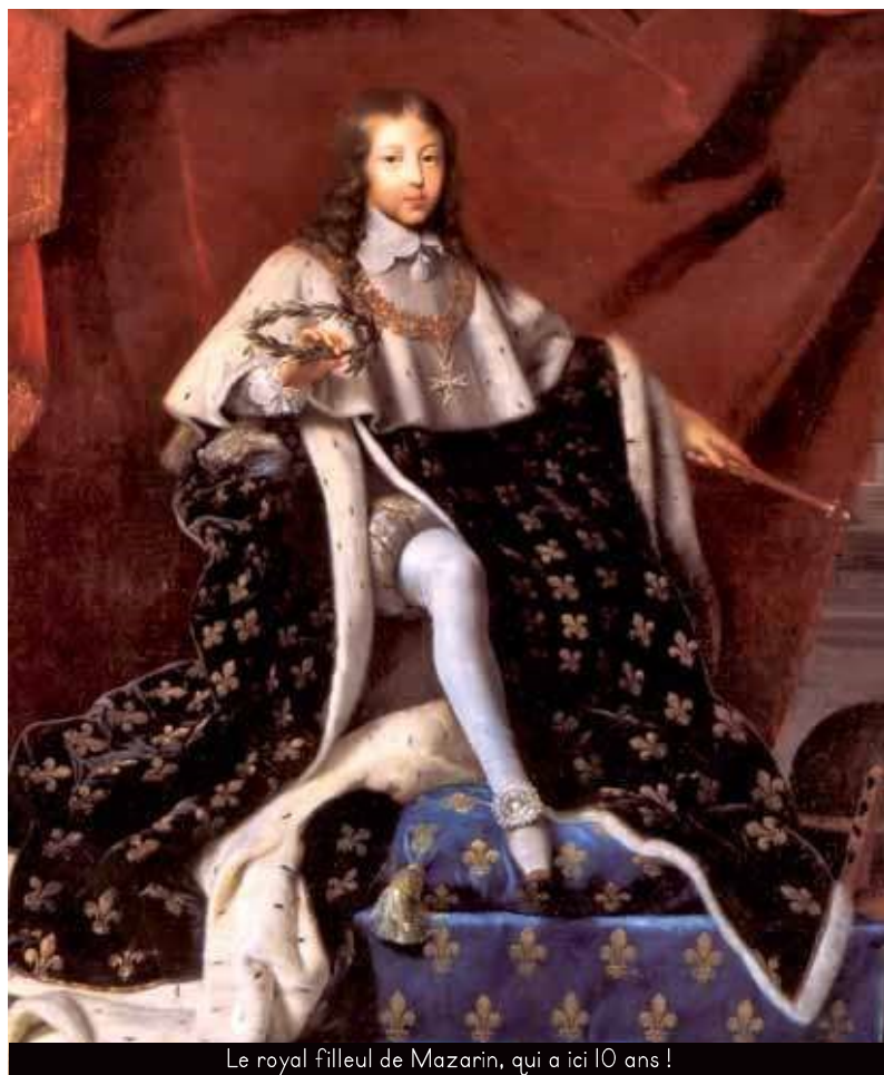
Le royal filleul de Mazarin, qui a ici 10 ans !

Quelques mois plus tard, en 1643, Louis XIII meurt à son tour. En est-ce déjà fini de Mazarin ? Non, car la femme du roi défunt, Anne d'Autriche, a besoin de son aide pour gouverner la France en attendant que le jeune Louis XIV ait l'âge de régner . Elle lui accorde son entière confiance, le laisse maître des affaires de l'État et le charge même de l'éducation de Louis XIV, dont il est le parrain. Sitôt en place, Mazarin doit faire face à des troubles importants.