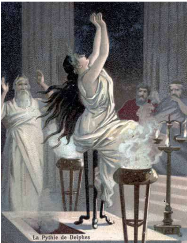
La Pythie de Delphes

Socrate se définit lui-même comme un philosophe, ce qui signifie littéralement en grec ancien « un ami de la sagesse ». Il se différencie des sophistes, des professeurs itinérants qui enseignent la rhétorique (l'art de bien parler en public). En effet, alors que ceux-ci font payer très cher leurs leçons, Socrate, lui, enseigne gratuitement. N'imagine pas des cours solennels donnés depuis une tribune devant des élèves assis en rang. Loin de là ! Tout se passe en plein air, sur l'agora, la grande place publique où les Athéniens se retrouvent pour le marché, le culte des dieux, les activités politiques... Socrate se promène au milieu d'eux, bavarde avec les uns et les autres, et naturellement, une foule de curieux se rassemble autour de lui pour l'écouter.