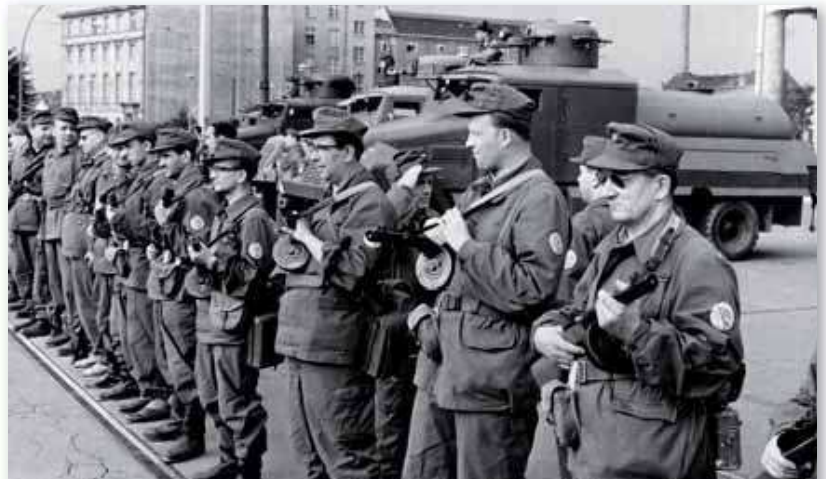
Au matin du 13 juin 1961, les militaires est-allemands forment une première barrière humaine.

C'est dans le plus grand secret qu'est mis au point, en 1961, un plan visant à empêcher définitivement cet exode de population . Dans la nuit du 12 au 13 juin , une vaste opération militaire est lancée à Berlin-Est pour « boucler » la zone soviétique : 25 000 hommes sont déployés pour interdire physiquement tout passage de l'autre côté !