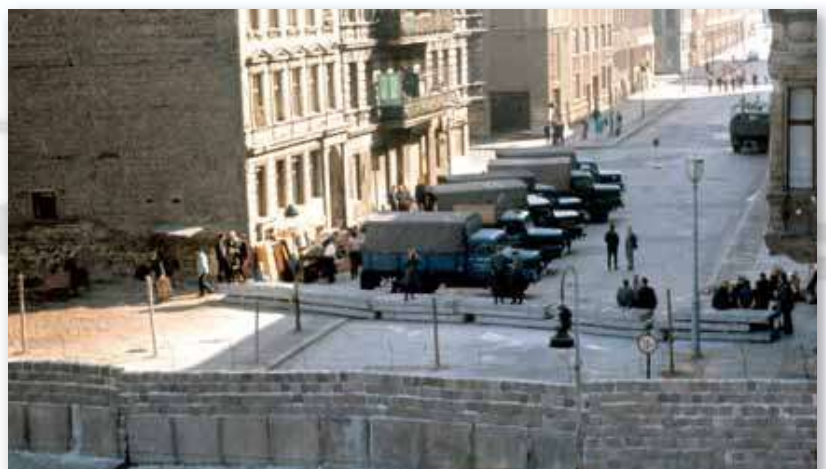
Dès le mois de septembre 1961, un premier mur est érigé et les immeubles se trouvant à proximité sont évacués.