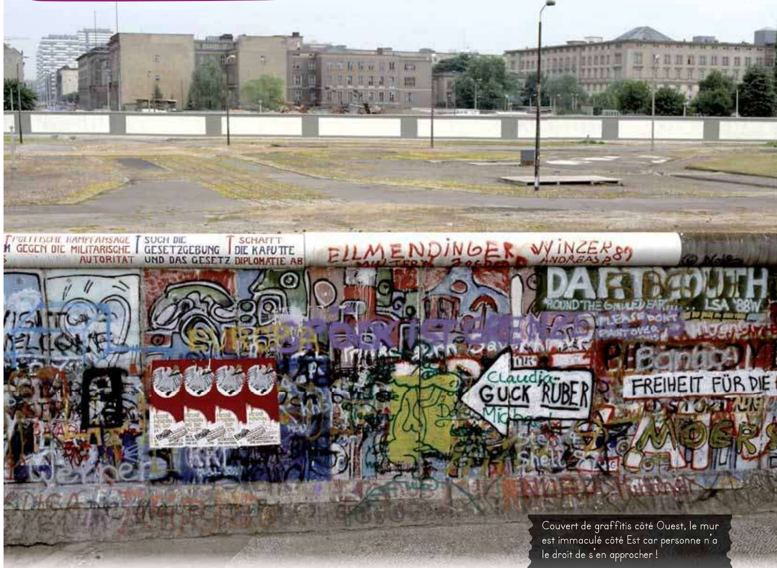
Couvert de graffitis côté Ouest, le mur est immaculé côté Est car personne n'a le droit de s'en approcher !